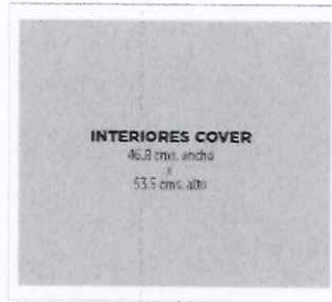
DOBLEZ a 18 cms. aprox.